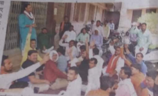
कार्यालय का गेट बंद कर धरना सभा करते छात्रों के दृश्य।

जास, वाराणसी: उच्चतर शिक्षा सेवा आयोग द्वारा आचार्य की डिग्री एमए (संस्कृत) के समकक्ष न मानने से संपूर्णानंद संस्कृत विश्वविद्यालय के छात्र नाराज हैं। बुधवार को छात्रों ने 'केंद्रीय कार्यालय बंद करके धरना-प्रदर्शन किया। इस दौरान छात्रों ने आयोग के खिलाफ जमकर नारेबाजी भी की। आयोग ने विश्वविद्यालय से आचार्य की उपाधि के आधार पर सहायक प्रोफेसर पद पर आवेदन करने वाले 18 आवेदकों का आवेदन भी निस्त कर दिया है। इसे लेकर छात्रों में उथाल है। केंद्रीय कार्यालय 'समग्र छात्रों ने सभा कर आयोग को बंद कर कोसा। बच्चाओं ने कहा कि इसी के नियमों के तहत ही शास्त्री-शर्मा की उपाधि विश्वविद्यालय दे रहा था नहीं हाईकोर्ट के निर्देशों के बाद 2011 से आचार्य की उपाधियों में (संस्कृत) का भी उल्लेख किया जा सकता है, वेद, व्याकरण, ज्योतिष, शिल्प अन्य विषयों का उल्लेख अब विषय के रूप में किया जा रहा है। आचार्य व एमए (संस्कृत) को भी उपाधि अंतर नहीं है। आचार्य की उपाधि को हटाने पर सहायक प्रोफेसर का पद निस्त कर दिया है। इस क्रम में छात्रों का आयोग के खिलाफ प्रदर्शन जारी है।